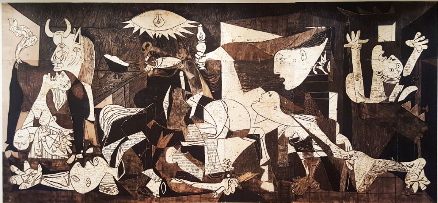
Damien Deroubaix, Garage days re-visited ,